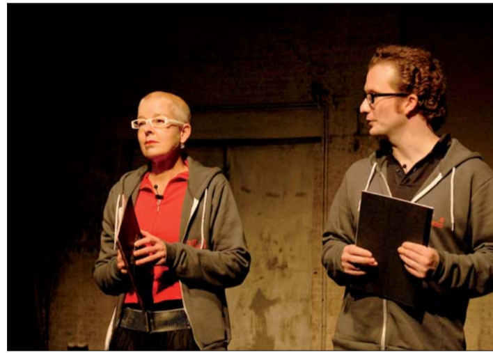
Zum Gehen lässt sich viel sagen.

gesunder Erwachsener? – Gehen lernen? Nun ja, warum nicht?